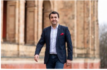
ARIFS MEINUNG MEHR UNTERSTÜTZUNG FÜR FAMILIEN