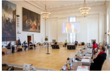
ARIF IM LANDTAG WINTERKLAUSUR DER SPD-FRAKTION