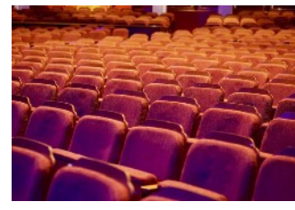
ARIF IM LANDTAG NEUSTART FÜR KUNST UND KULTUR VORBEREITEN